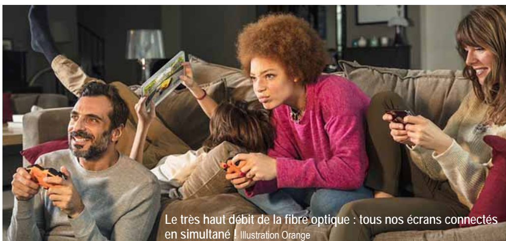
Le très haut débit de la fibre optique : tous nos écrans connectés en simultané ! Illustration Orange

Dès ce mois de Janvier, près de 200 foyers villeréalais pourront profiter de cette avancée technologique. L'ensemble de la commune devrait être raccordée d'ici la fin de l'été. ■