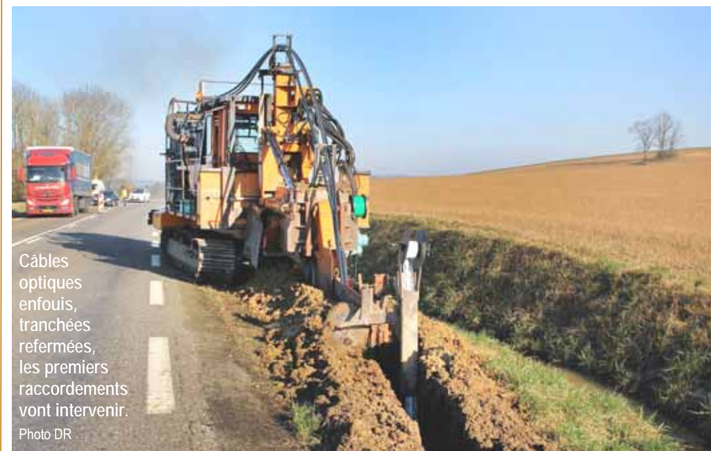
Câbles optiques enfouis, tranchées refermées, les premiers raccords vont intervenir.