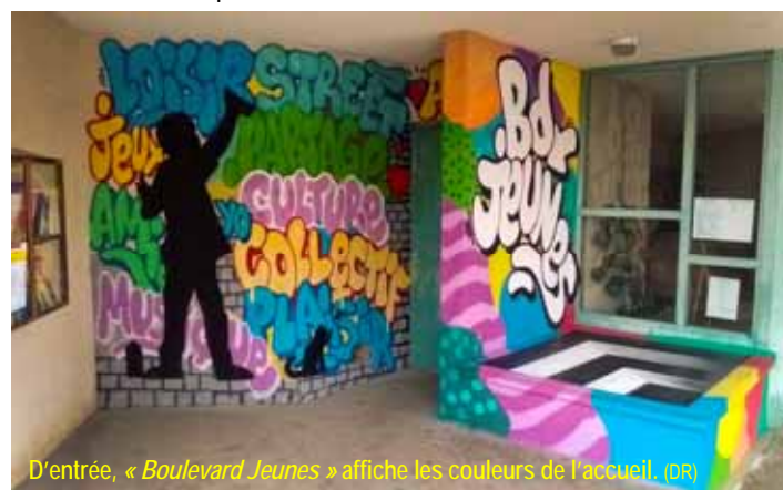
D'entrée, « Boulevard Jeunes » affiche les couleurs de l'accueil. (D.R.)

Pour les vacances de Noël, les ados de « Boulevard Jeunes » ont organisé un atelier de Street Art , un art graphique consistant à peindre à la bombe sur des surfaces en milieu urbain (murs, trottoirs...). Un groupe d'une dizaine de jeunes ont ainsi décoré l'entrée de leur local situé à l'Espace Jean-Moulin. Avec l'aide et les conseils d'un professionnel, ils continueront cet atelier artistique durant le premier semestre de cette année.