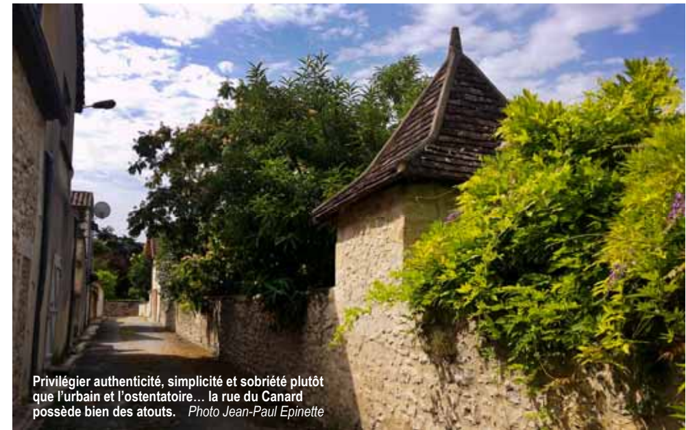
Privilégier authenticité, simplicité et sobriété plutôt que l'urbain et l'ostentatoire... la rue du Canard possède bien des atouts.