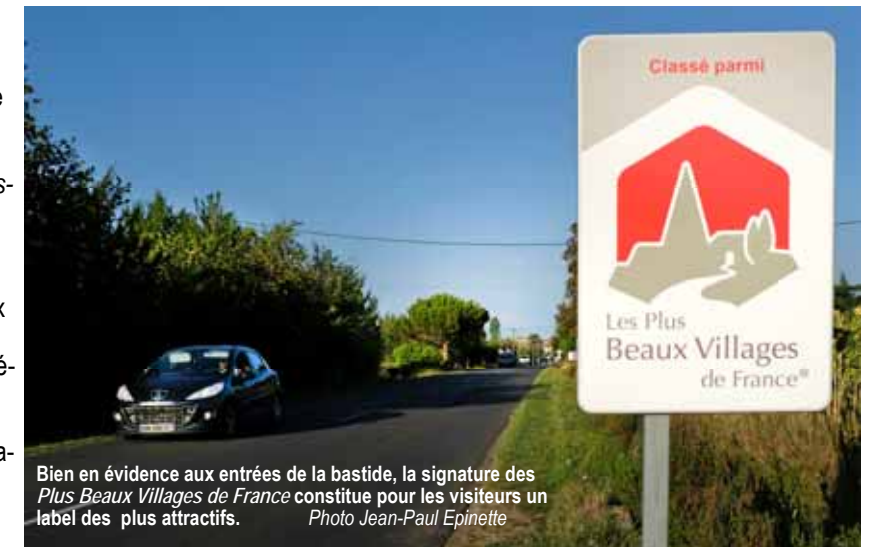
Bien en évidence aux entrées de la bastide, la signature des Plus Beaux Villages de France constitue pour les visiteurs un label des plus attractifs.